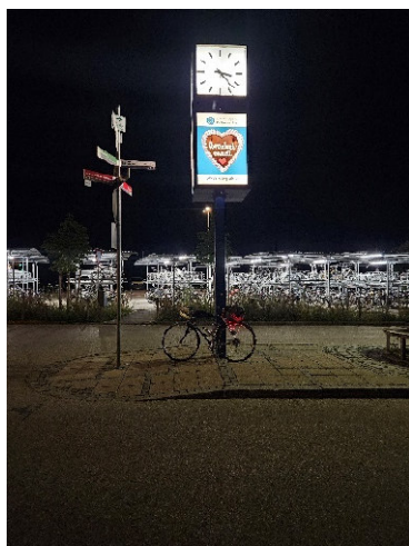
Foto vor S-Bahn Uhr