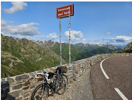
Foto mit Passschild Timmelsjoch