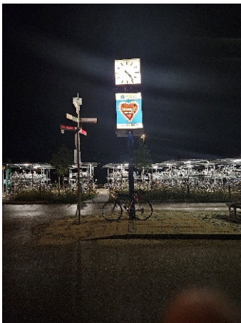
Foto mit Bahnhofsuhr