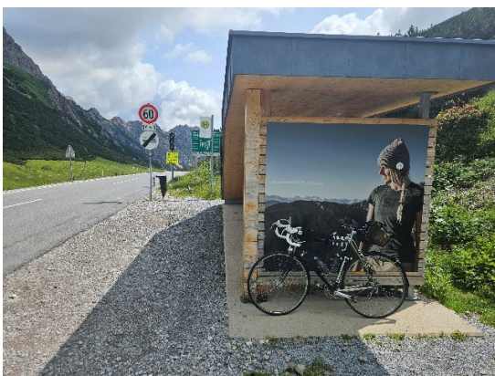
Foto vor Bushaltestelle