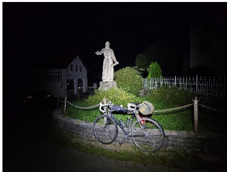
Foto vor der Statue