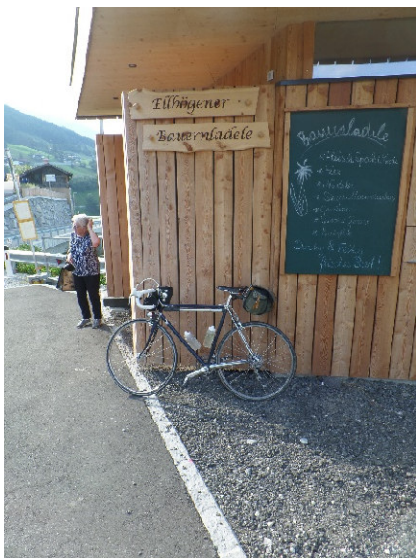
Foto vor „Ellbögener Bauernlädele“ auf der linken Seite, rechts Gemeindeamt