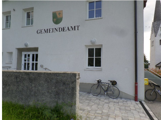
Foto vor dem Gemeindeamt