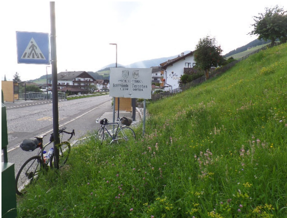
Foto vor Schild „Partnergemeinden Edermünden – Terenten“, kurz vor Cafe Sonne