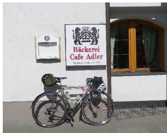
Foto vor Bäckerei/Cafe Adler