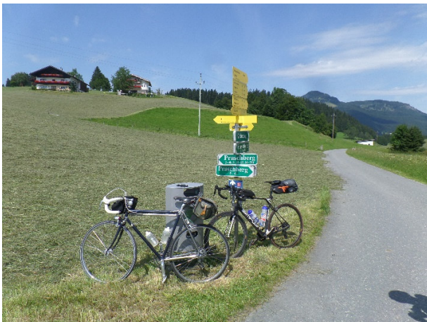
Foto Wegweiser oben nach Aufstieg zum Prashberg/Neudorfer Berg.