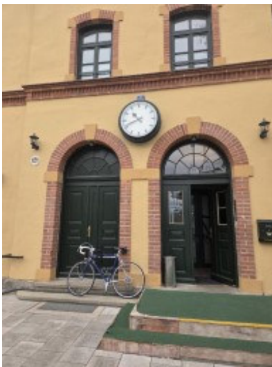
Foto mit Bahnhofsuhr