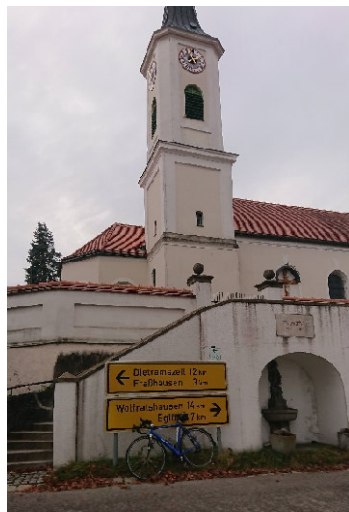
Foto vor Verkehrsschild an Kreuzung mit Kirchturmuh