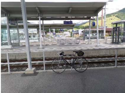
Foto auf Bahnsteig Hochfilzen