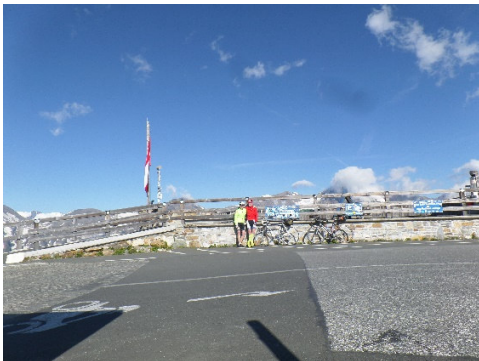
Foto vor Schild „Willkommen, Welcome Edelweißspitze“ vor Aussichtsplattform