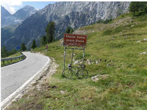
Foto vom Paßschild mit Rad (Schild steht kurz hinter der Ampel, schon etwas in der Abfahrt